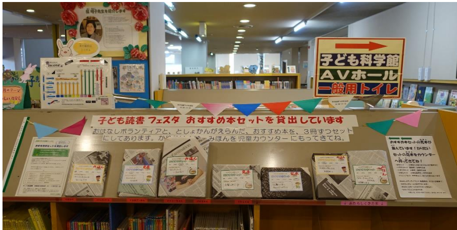
おすすめ本セット貸出 手作りガーランドによる館内装飾