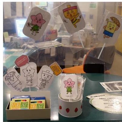
ボランティア作成のペープサート