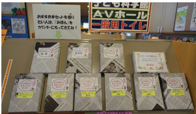
←おすすめ本セットの貸出

フェスタ期間中の来館者・貸出者（子ども）にぬりえ等のプレゼントを配布（340点）