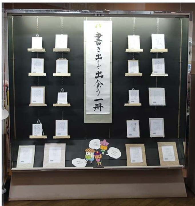
図書館サポーター企画による一般特集架 「書き出しで出会う一冊」 令和3年7月～8月開催 中身が見えないように1冊ずつ包装し、表に書き出し文を貼り付けた本を展示。書き出し文から直感をたよりに、あるいは、書かれた内容を想像力を働かせ、読む本を選ぶ趣向。本好きの、本好きによる、本好きのための、遊び心にあふれた企画。