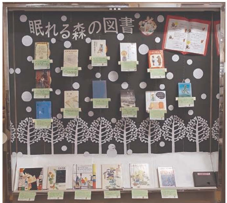
図書館サポーター企画による一般特集架 「眠れる森の図書」 令和4年12月～令和5年3月開催