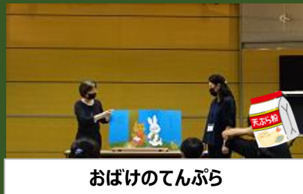
おばけのてんぷら