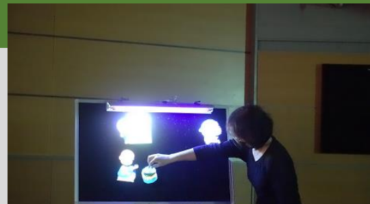
三まいのおふだ(ブラックパネルシアター)