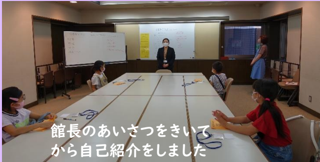
館長のあいさつをきいてから自己紹介をしました