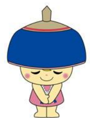
伊勢原市公式イメージキャラクター クルリン